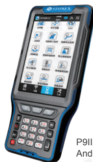
P9II工業級 Android智慧型終端控制器